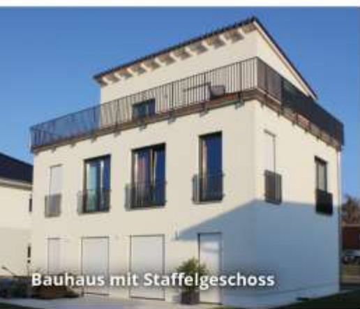
Bauhaus mit Staffelgeschoss