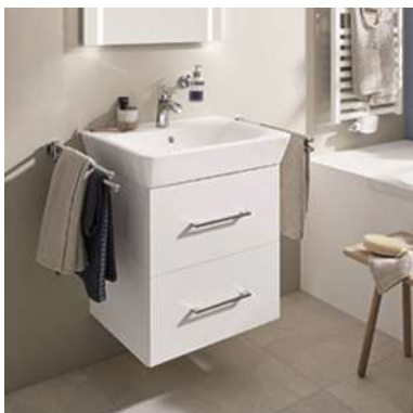
Fabrikat Villeroy & Boch Modell ONOVO