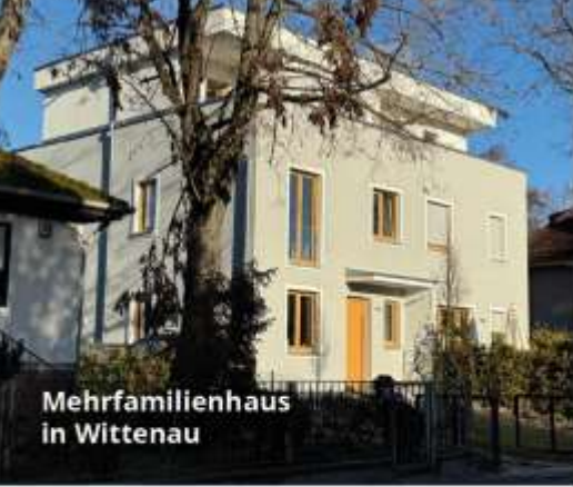
Mehrfamilienhaus in Wittenau