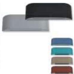
Carrier Inneneinheiten (stoffbezogen) in verschiedenen Farben "High Wall" 40 WHP möglich