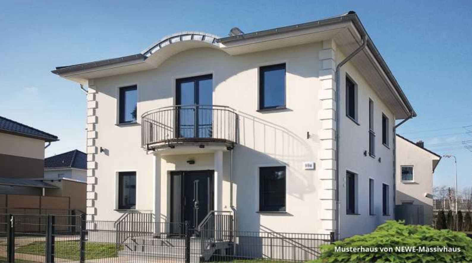
Musterhaus von NEWE-Massivhaus