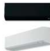
Carrier Inneneinheiten (Kunststoff) in Weiß oder Schwarz "High Wall" 40WHH möglich