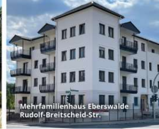
Mehrfamilienhaus Eberswalde Rudolf-Breitscheid-Str.