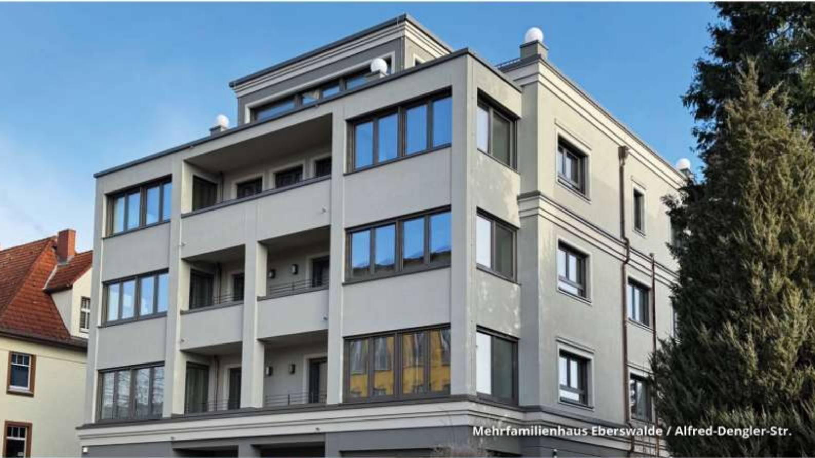
Mehrfamilienhaus Eberswalde / Alfred-Dengler-Str.