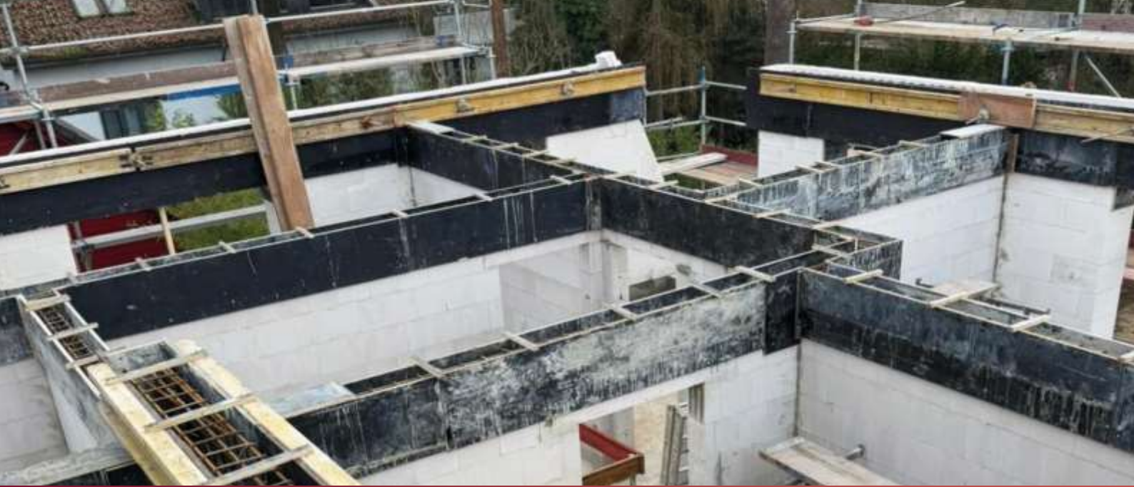
Ringanker über alle Innen- und Außenwände in allen Etagen