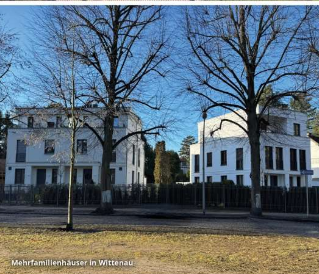
Mehrfamilienhäuser in Wittenau