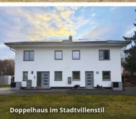
Doppelhaus im Stadtviennenstil